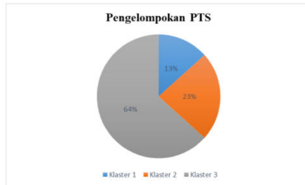
Gambar 3. Pengelompokan Perguruan Tinggi Swasta

Gambar 3 menunjukkan hasil cluster paling optimal yang terbentuk. Dari hasil perhitungan iterasi-3 yang merupakan hasil final dari rangkaian proses k-means clustering yang telah dilakukan sebelumnya. Dari 30 data yang digunakan diperoleh hasil akhir 3 klaster pengelompokan perguruan tinggi swasta di madura berdasarkan kinerja sumber daya manusia dan mahasiswa. Klaster 1 (Tinggi) terdapat 4 Perguruan Tinggi Swasta dengan rata-rata K1 yaitu 11,5, K2 yaitu 1,5, K3 yaitu 0,041, K4 yaitu 0 dan K5 yaitu 0. Klaster 2 (Menengah) terdapat 7