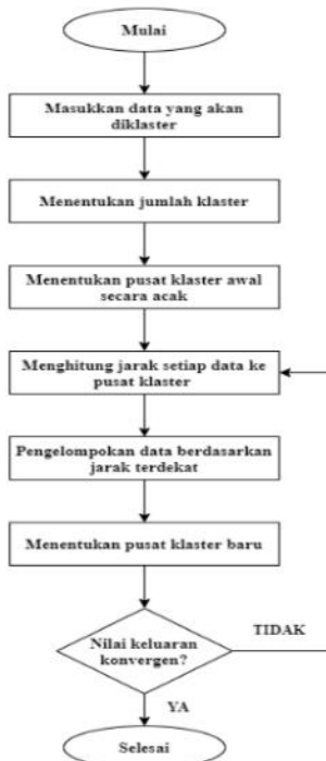
Gambar 2. Flowchart K-Means Clustering

2 Flowchart atau diagram alir merupakan sebuah diagram dengan simbol-simbol grafis yang menyatakan aliran algoritma atau proses yang menampilkan langkah-langkah yang disimbolkan dalam bentuk kotak, beserta urutannya dengan menghubungkan masing-masing langkah tersebut menggunakan tanda panah. Diagram ini bisa memberi solusi selangkah demi selangkah un 22 penyelesaian masalah yang ada didalam proses atau algoritma tersebut [15][17]. Adapun alur proses metode k-means clustering dapat dilihat pada Gambar 2