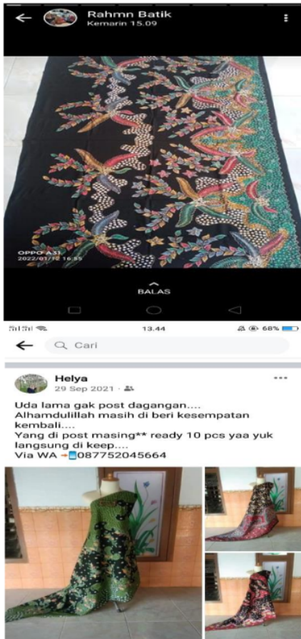
Gambar 1. Contoh Promosi Batik Para Pengrajin Klampar di Medsos

batiknya secara tradisional di Pasar 17 Agustus pamekasan, sedangkan sebagian lainnya menjual secara online melalui media sosial maupun story whatsapp .