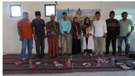
Gambar 3. Pelaksanaan Sosialisai II