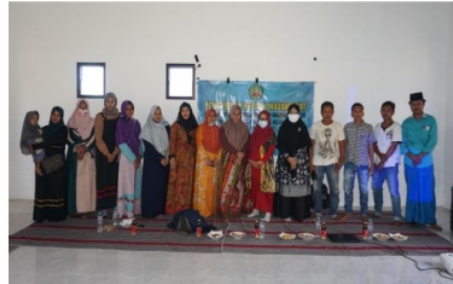
Gambar 2. Pelaksanaan sosialisasi I

pemasaran online. pada forum ini diikuti oleh 25 pengrajin batik dihasilkan kesepakatan bahwa mereka tertarik melaksanakan pemasaran online menggunakan marketplace .