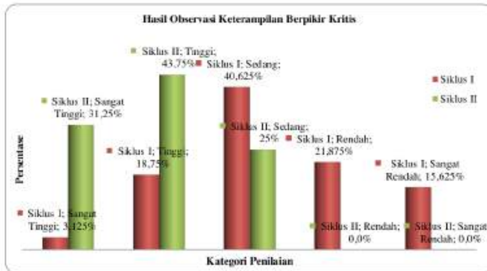
Gambar 2. Data Observasi Hasil Keterampilan Berpikir Kritis Siswa

Berdasarkan gambar 2, hasil penelitian yang telah dilakukan pada siklus I dan siklus II diperoleh hasil bahwa kemampuan berpikir kritis siswa meningkat dari awal pra siklus, siklus I ke siklus II, untuk melihat peningkatan kemampuan berpikir kritis siswa selama mengikuti pembelajaran, berikut disajikan tabel peningkatan kemampuan berpikir kritis siswa dari masing-masing siklus.