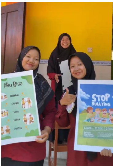
Lingkungan budaya literasi