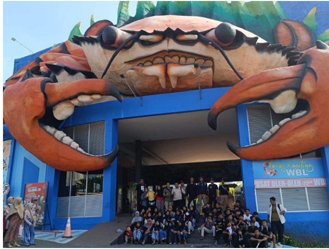
Pendampingan study tour