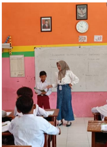
Kegiatan membaca nyaring