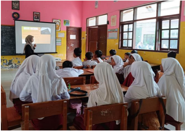
Pembelajaran tentang cyber crime