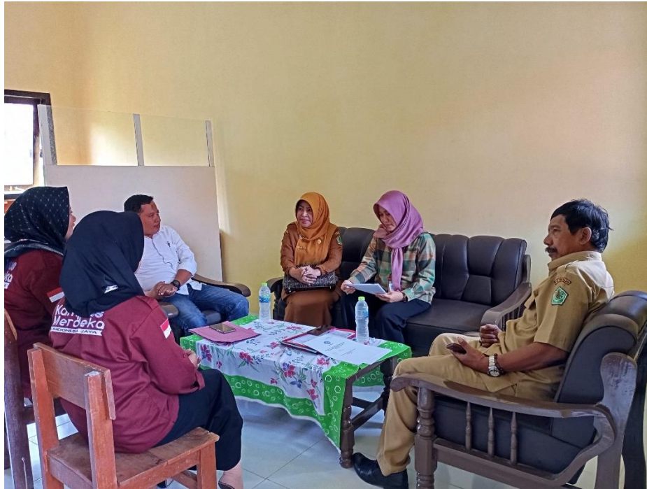
Pendampingan moneyv dari BBPMP Provinsi Jawa Timur