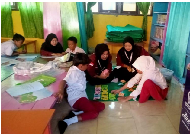
Bimbingan bagi kurang mahir membaca