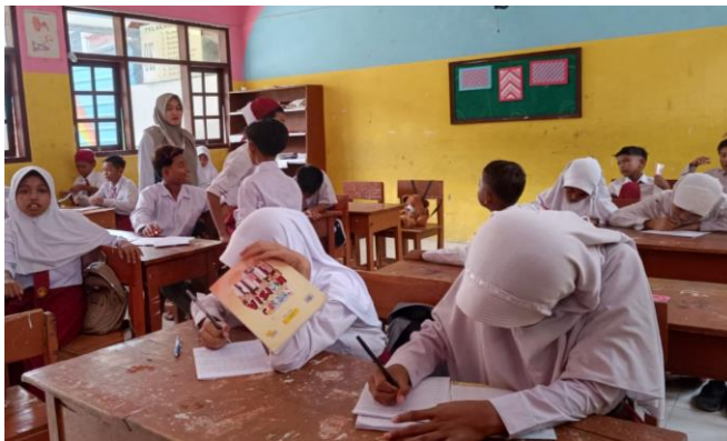
Pembuatan jurnal aktivitas