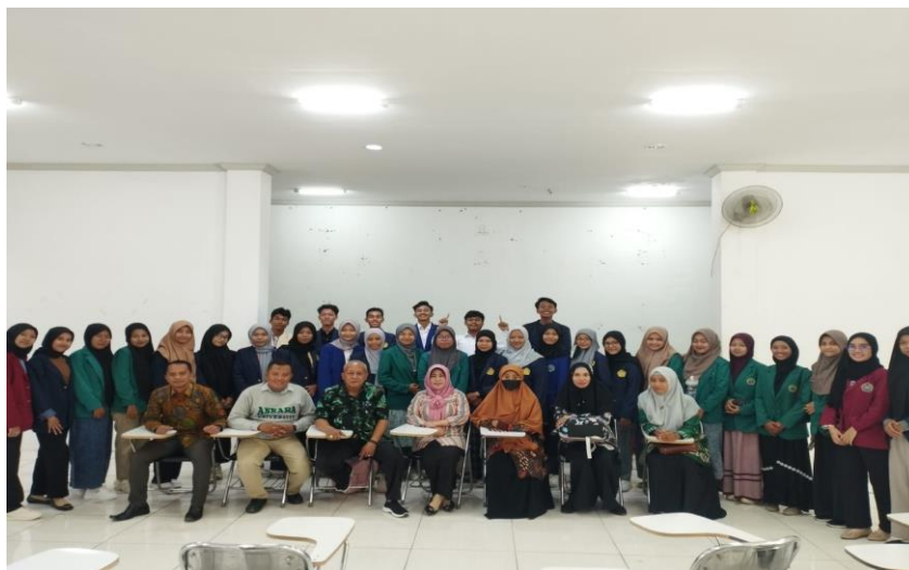
Pelepasan di Dinas Pendidikan Kabupaten Pamekasan