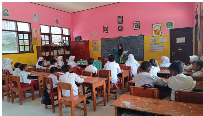
Kegiatan membaca 15 menit