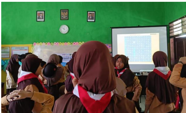
Mengenalkan aplikasi quiziz