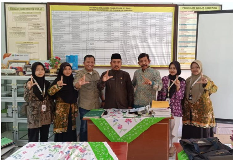
Kegiatan FKKS II