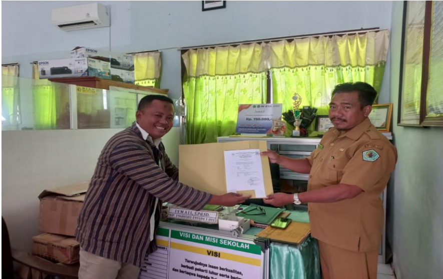
Penyerahan kepada pihak sekolah