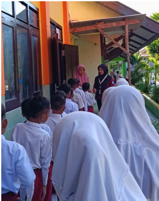
Pengenalan sikap baik dan buruk