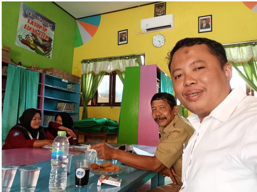
Koordinasi dengan guru pamong