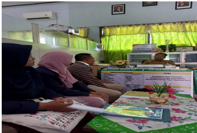
Koordinasi dengan pihak sekolah