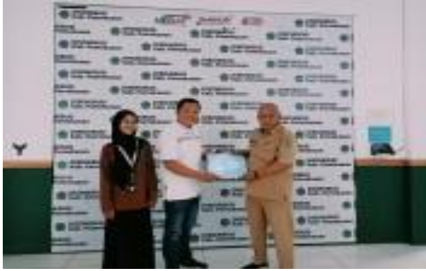
Penyerahan RAK ke Dinas Pendidikan Kabupaten Pamekasan