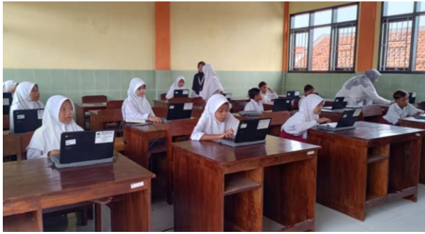
Pemasangan chrome book di lab