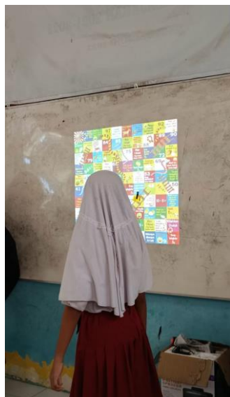
Pengembangan media pembelajaran literasi dan numerasi