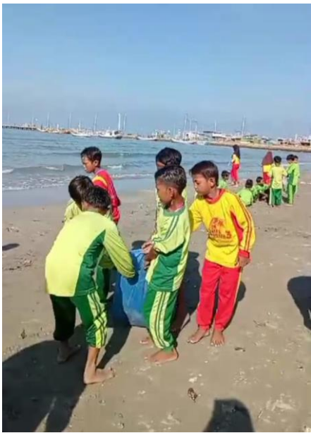
Gerakan peduli lingkungan