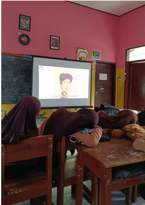
Penggunaan media pembelajaran berbasis video