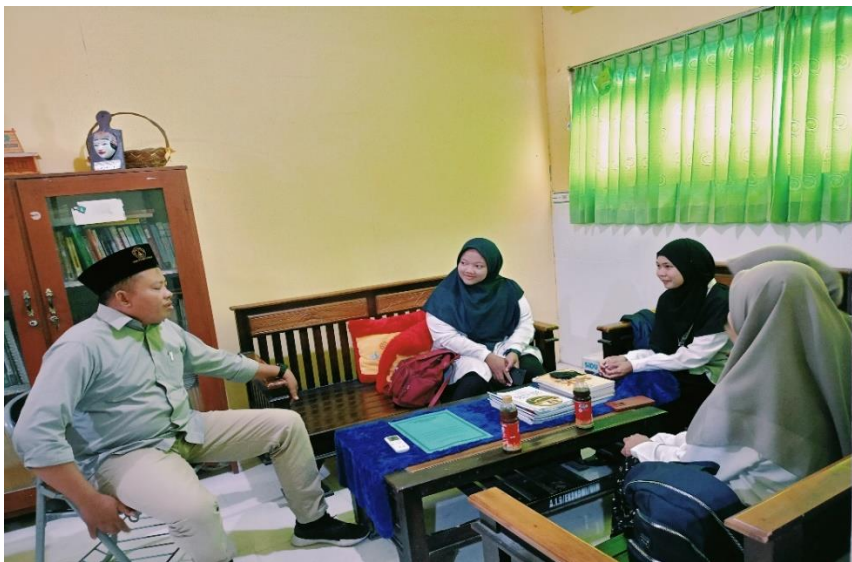
Sharing session dengan mahasiswa