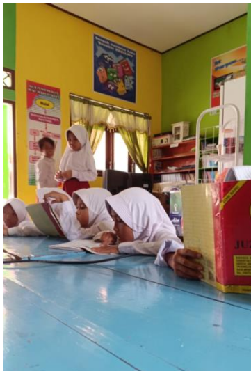
Kegiatan berkunjung ke perpustakaan