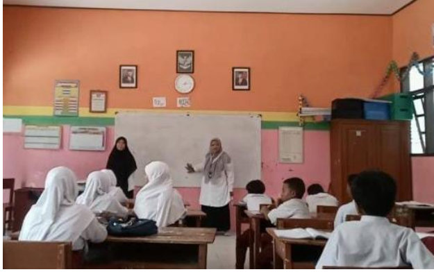
Permainan berbasis angka