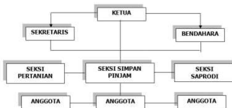
Gambar 2. Struktur Organisasi Kelompok Tani Di Desa Panaguan (Sumber : Struktur Organisasi Kelompok Tani Harapan Jaya)