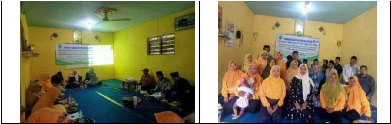
Gambar 5. Pendampingan Pelatihan Manajemen Keuangan Sederhana