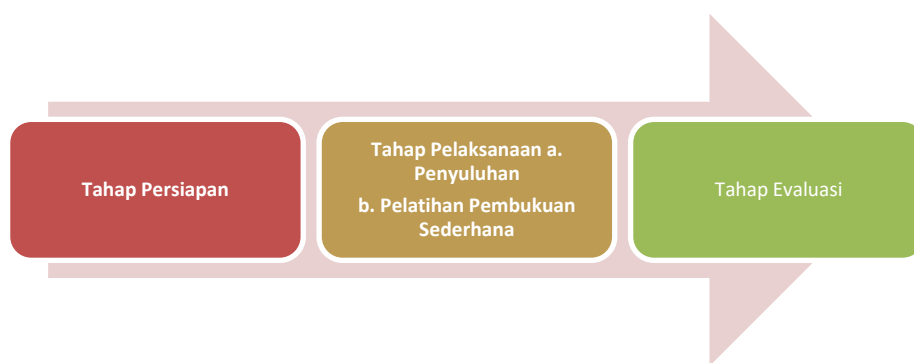
Gambar 3. Metode Pelaksanaan Pengabdian

Melakukan evaluasi sebelum, selama, dan setelah kegiatan untuk mengevaluasi keberhasilan program pengabdian ini. Metode pelaksanaan program pengabdian pada Kelompok Tani Harapan Jaya di Desa Panaguan Kecamatan Larangan Kabupaten Pamekasan disajikan pada Gambar 3.