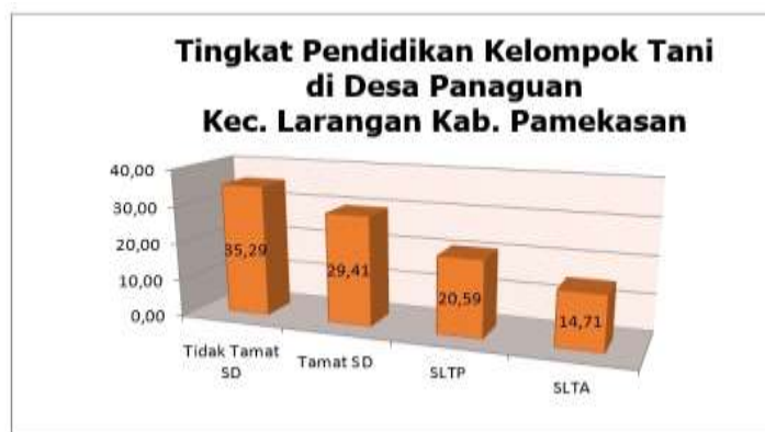
Gambar 1. Grafik Jenjang Pendidikan Kelompok Tani di Desa Panaguan Kecamatan Larangan Kabupaten Pamekasan

Menurut Kurniati dan Vaulina (2020) jenjang pendidikan yang rendah dapat menyebabkan kualitas sumberdaya manusia petani kurang memadai untuk usaha peningkatan kinerja usahatani yang lebih baik, khususnya dalam pengelolaan keuangan kelompok tani. Sehingga berdasarkan kondisi tersebut, maka kami memandang perlu untuk dilakukannya kegiatan pengabdian pada Kelompok Tani Harapan Jaya melalui kegiatan pelatihan manajemen keuangan sederhana untuk meningkatkan keterampilan pengelolaan keuangan kelompok tani.