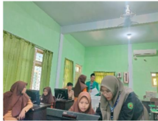
Gambar 2. Dokumentasi Sosialisasi Aplikasi

Dalam tahapan ini kami memberikan pemahaman terhadap guru dan siswa akan pentingnya teknologi dan system yang akan di terapkan nanti. Selama 1 bulan menggiring siswa dan guru untuk menggunakan system presensi yang kami bangun secara sederhana, untuk lebih mendalami manfaat terkait Excel kepada siswa-siswi yang ada di Madrasah Aliyah swasta Al-Djufri dan juga memberikan pemahaman terhadap operator sekolah tentang bagaimana sistem yang ada pada Excel dan juga terkait penggunaan atau fungsi dari kode QR atau QR Code.