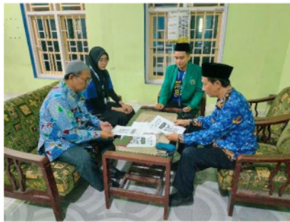
Gambar 5. Penyerahan Hasil

Dengan demikian, hasil dari pengabdian ini memberikan indikasi positif terhadap efisiensi administratif dan kualitas pembelajaran di Madrasah Aliyah AL-Djufri melalui digitalisasi menggunakan Microsoft Excel dan QR Code. Namun, upaya berkelanjutan dan pengembangan teknologi masa depan perlu di implementasikan agar manfaat optimalisasi ini dapat terus dirasakan dalam jangka panjang.