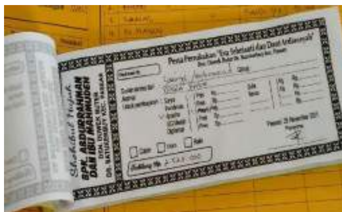
Gambar 5: Bentuk kwitansi remoh