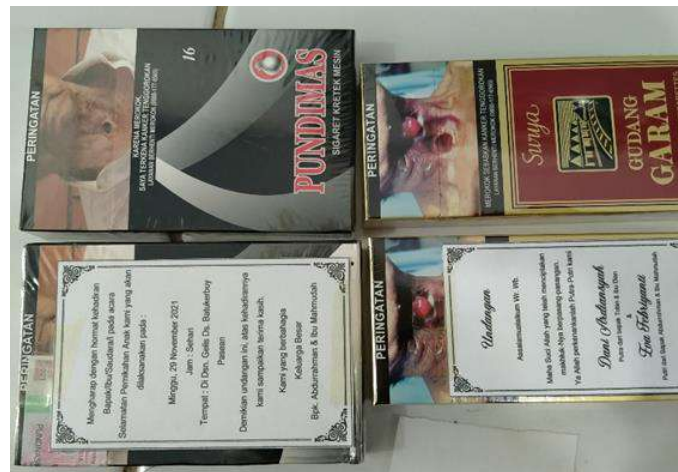
Gambar 3: Undangan untuk lokal