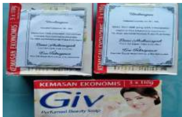
Gambar 2: Undangan untuk Anggota Arisan

“Untuk ropanah undangan neng acara remoh reah bisah aropah Kertas biasah, rokok, ben bisah aropah sabun. Mun rokok e beki ka kalompok rombongan se derih loar, sedangkan mun se sabun se beki khusus untuk se sakampongan ben biasanah e beki ka bini`an.“. (Ridho`e)