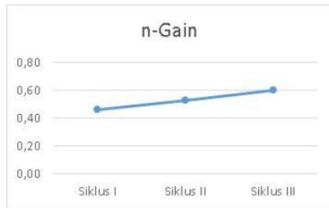
Gambar 1. Grafik Peningkatan Hasil Belajar mahasiswa