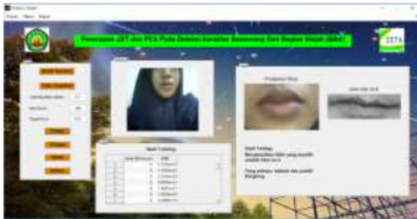
Gambar 2. Hasil Simulasi Pengenalan Karakter Bibir menggunakan Matlab R2013a

Dan dari persamaan (11) hasil simulasi menggunakan Matlab R2013a dapat digambarkan seperti dalam Gambar 2.